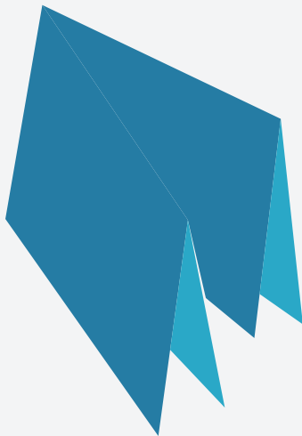
dobra em cruz